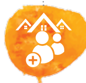
คณะอนุกรรมการ ด้านพัฒนาสังคม และการมีส่วนร่วม Sub SMC - Society and Inclusive Development