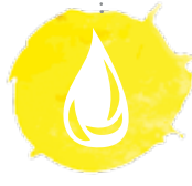
คณะอนุกรรมการ ด้านการจัดการน้ำ Sub SMC - Water Management