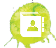
คณะอนุกรรมการ ด้านการศึกษาและพัฒนา ทรัพยากรมนุษย์ Sub-SMC - Education and Human Resource Development