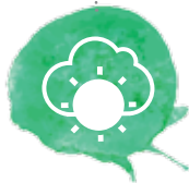
คณะอนุกรรมการ ด้านการเปลี่ยนแปลง สภาพภูมิอากาศ Sub SMC - Climate Change