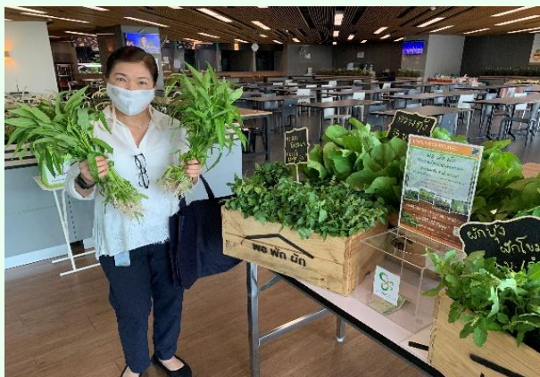
ผู้จำหน่ายผลผลิตโครงการ