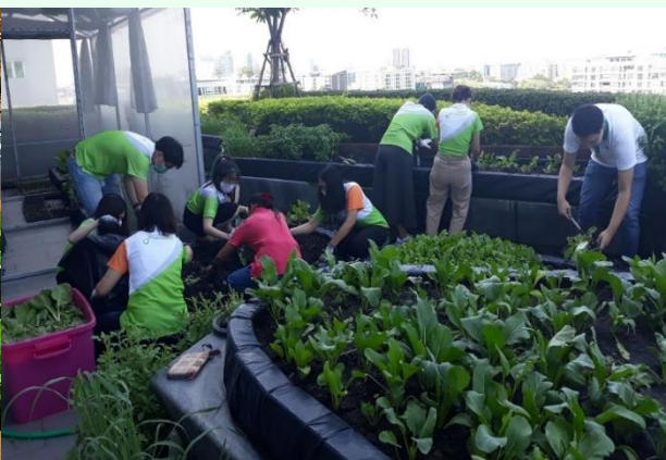
กิจกรรมเชื่อมสัมพันธ์พนักงาน