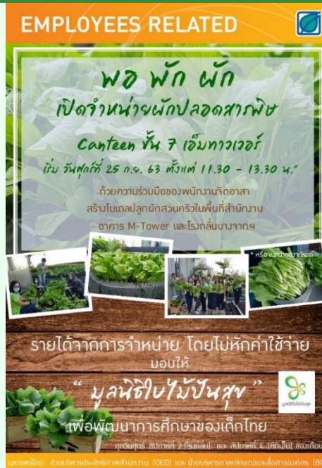
ประกาศประชาสัมพันธ์พนักงาน