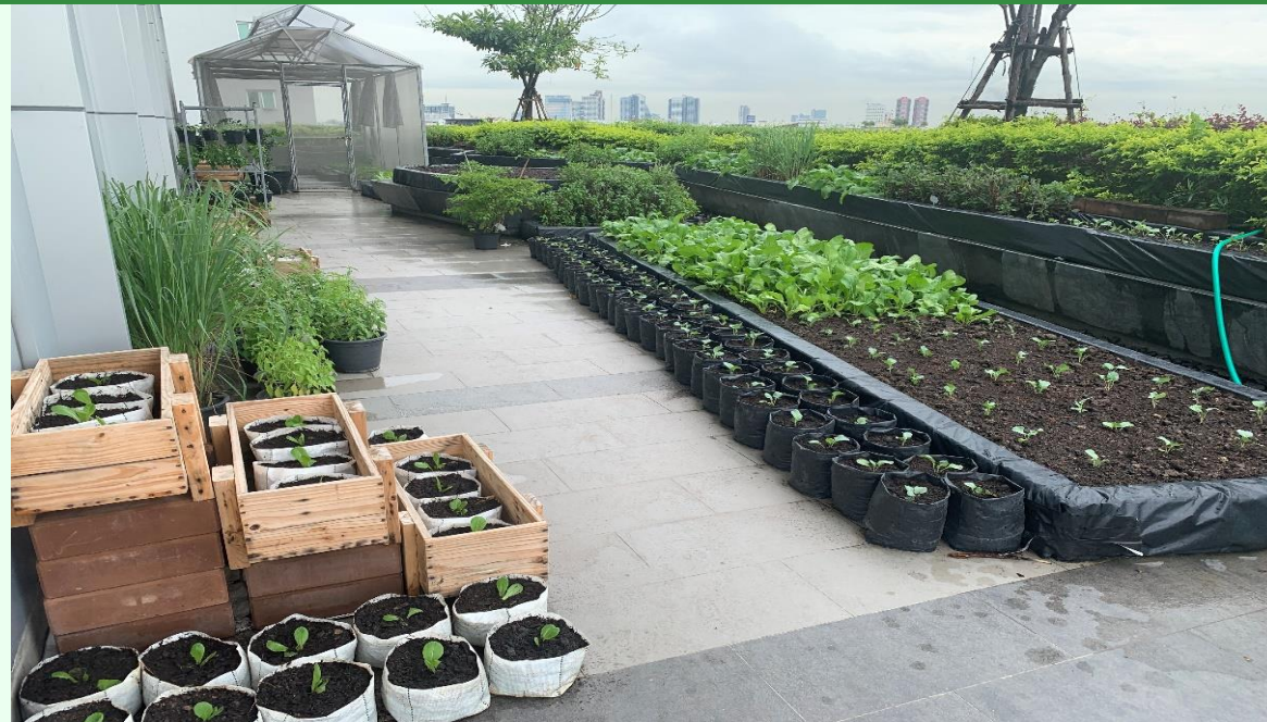
ภาพรวมโครงการบนพื้นที่สวน 96 ตร.ม. ที่ชั้น 8 อาคาร M-Tower